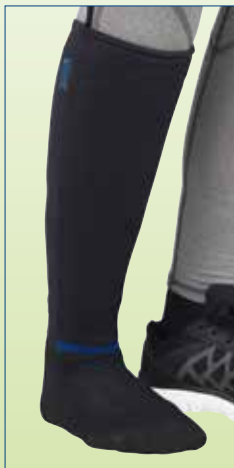
Vedä koko sukka jalkaan polveen asti.

CoverKIT™ 2.0 on fiksu ratkaisu, joka tekee ortoosista matalaprofiilisen sekä pitää ortoosin ja pehmusteen paikallaan ilman nauhoja!