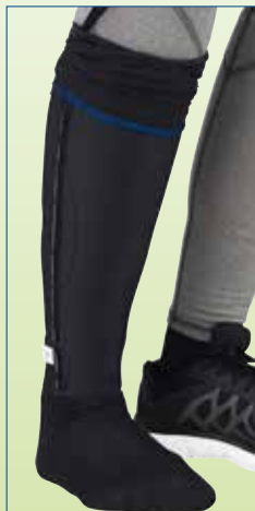
Ota kiinni päällimmäisestä kerroksesta sinisen sauman kohdalta ja vedä se ylös.