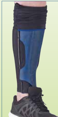
Jos tarpeen aseta tässä vaiheessa neopreeniliuskat ortoosiin kiinni. Aseta ortoosi ja jalka kenkään ja paina sitten ortoosi sukkaa vasten kiinni. Tartu kiinni sinisestä saumasta ja vedä sukan päällimmäinen kerros ortoosin päälle. Tarvittaessa voit myös käyttää sukan lisäksi ortoosiin kuuluvia nauhoja.