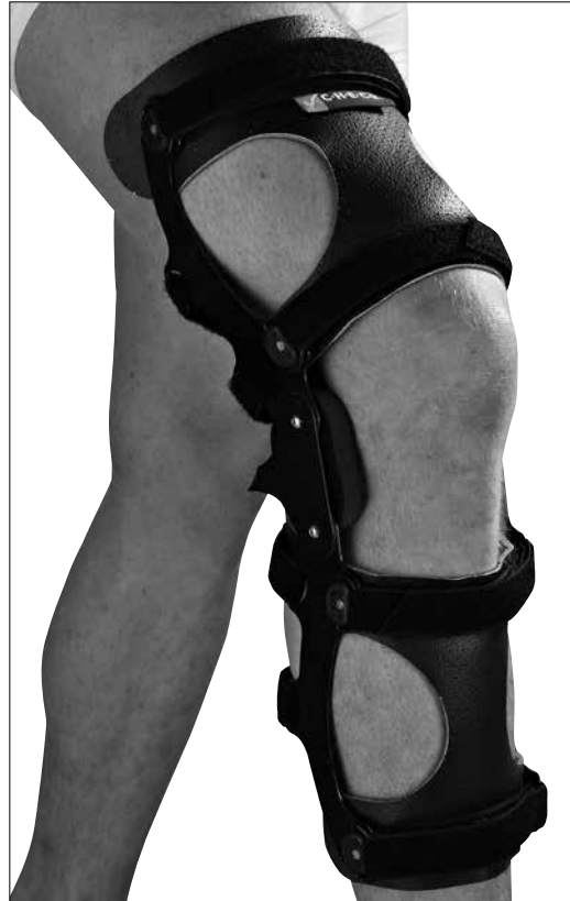
CHECK TM STAINLESS STEEL