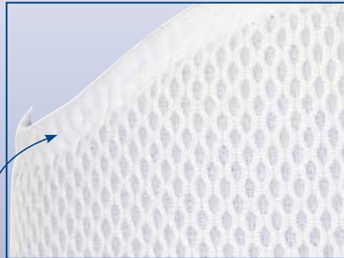
Korsetin joustava ja ohut rakenne jättää tilaa paksummalle pehmusteelle.