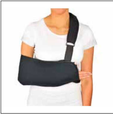
Mitta: Kynärvarren mitta